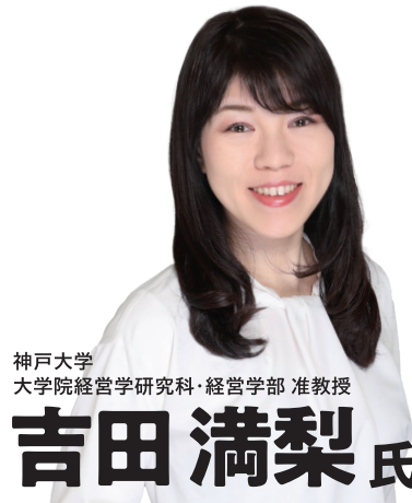
神戸大学 大学院経営学研究科・経営学部 准教授